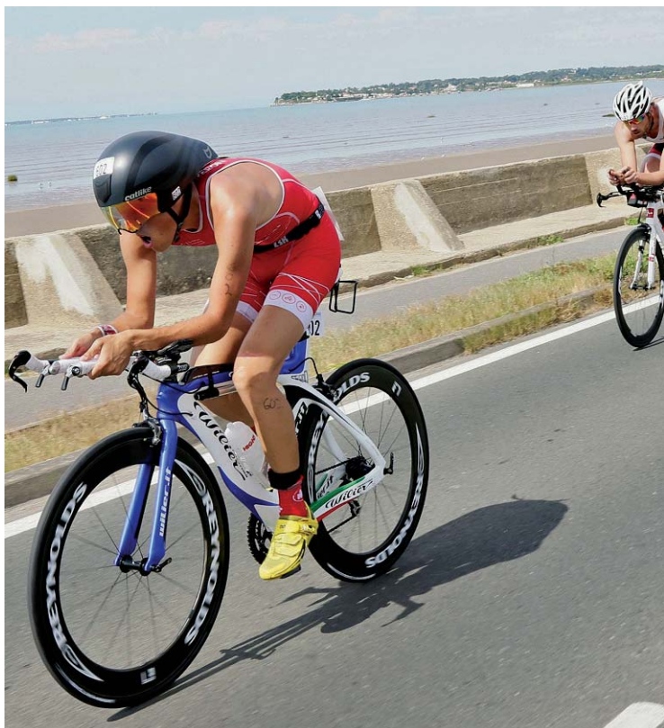
Les concurrents n'ont pas eu le temps d'admirer le paysage. R.A.