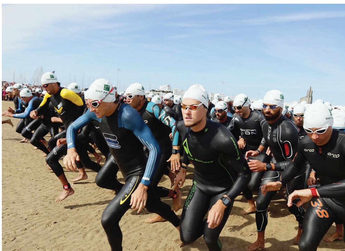
Avec 804 engagés, l'épreuve a connu un nouveau record de participation.